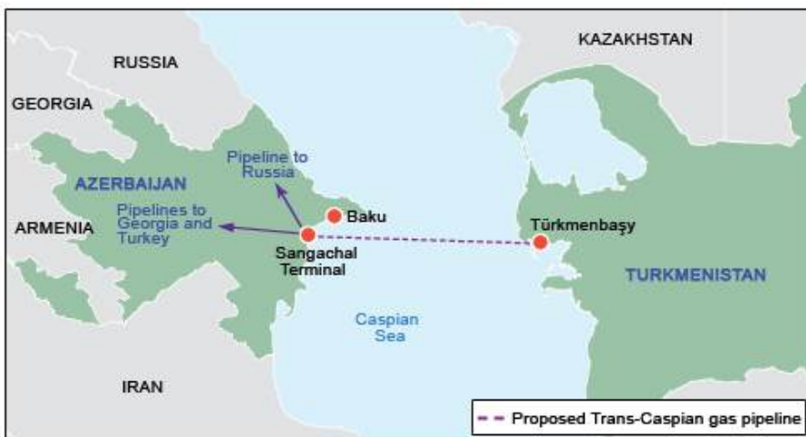
그림 3. 카스피해 횡단 해저 가스관 계획