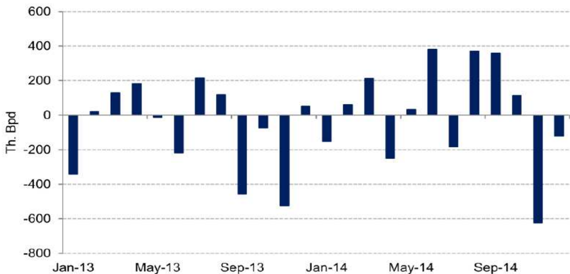
Change in OPEC oil output (m/m)