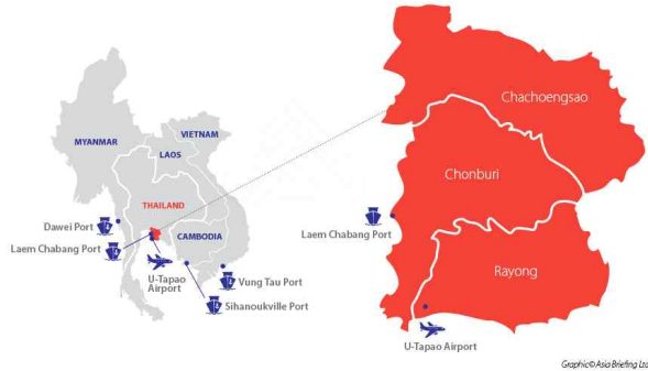
Thailand's Eastern Economic Corridor